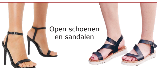
Open schoenen en sandalen