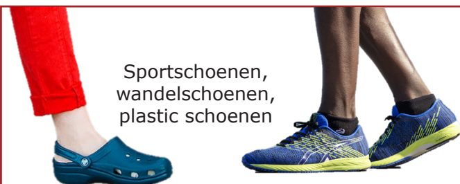
Sportschoenen, wandelschoenen, plastic schoenen