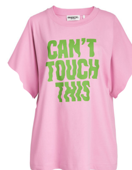
Tops met teksten