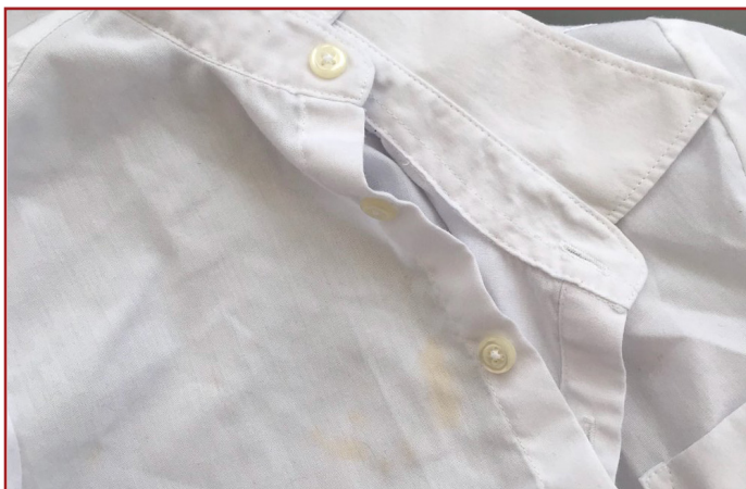
Kleding met vlekken of draagsporen