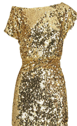
Kleding met glitter